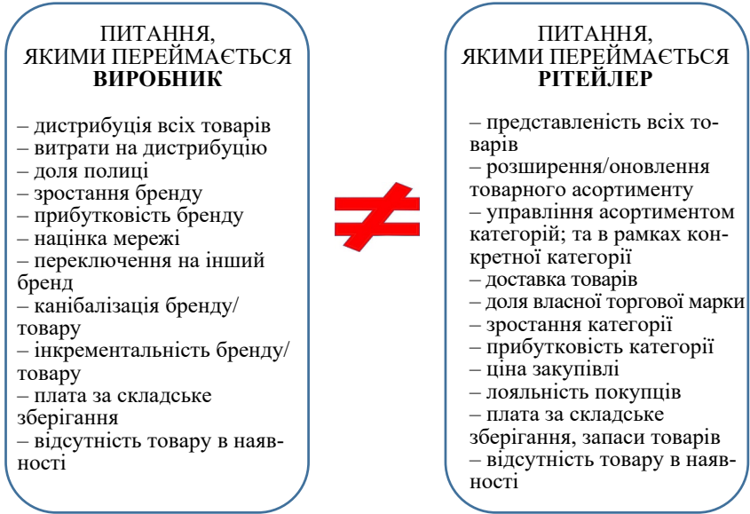
Рис. 2. Конфлікти інтересів виробника та ритейлера

приємств харчової промисловості мають чітко визначити та нейтралізувати конфлікти інтересів всіх учасників товаропротування, основні передумови яких систематизовано на рис. 2.